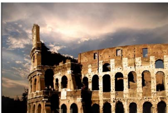
Рис. 1. Изображение 1

Откройте два изображения приблизительно с одинаковой цветовой гаммой.