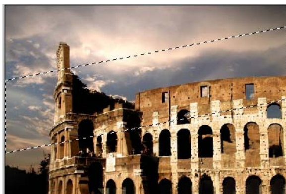
Рис. 4. Выделение внутри изображения

Вернитесь обратно в нормальный режим Normal Mode , снова нажав клавишу Q , и вы увидите выделение внутри изображения (рис. 4).