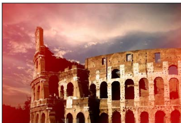
Рис. 3. Быстрая маска

В режиме Quick Mask Mode (Быстрая маска) белый цвет градиента выглядит прозрачным, а черный - красным. Чем краснее участок, тем прозрачнее будет это место на картинке (рис. 3).