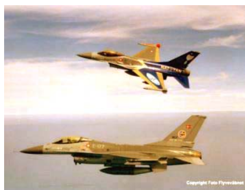
Рис. 2. Изображение 2

Если одно изображение больше или меньше другого, то желательно уравнивать их размеры, посредством команды Image → Image Size (Изображение → Размер изображения), можно сразу задать размер, предполагаемый для конечного изображения, например, 600x400.